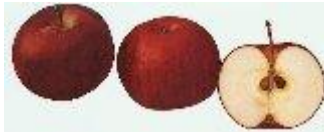
Apples of New York, 1905, SA Beach. Merci Alain Rouèche.

ORIGINE: Amérique aux environs de New-York . Introduite en France vers 1820.